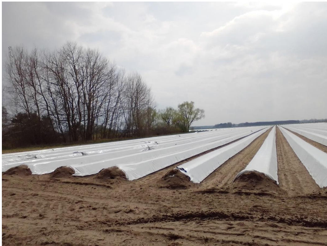
Bild 10: Blick nach Süden auf Spargelflächen im Westteil des Plangebiets