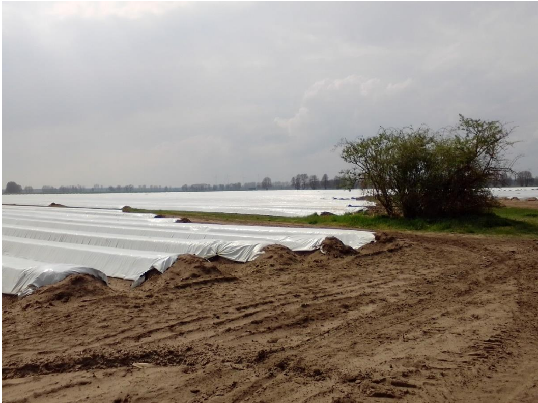
Bild 9: Blick nach Südwesten auf Spargelflächen im Westteil des Plangebiets