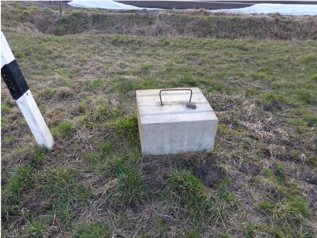
Bild 1: Blick auf vorhandenen Brunnen, der reaktiviert werden soll