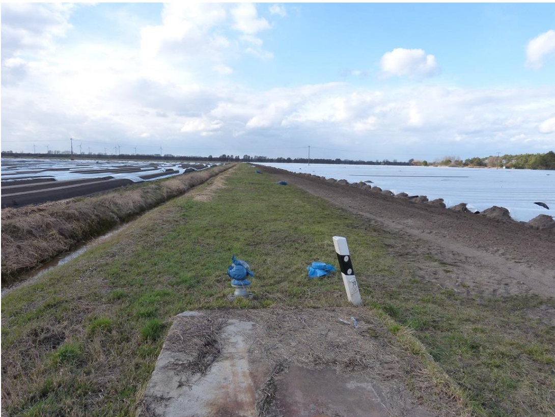
Bild 2: Blick auf vorhandenen Pegel westlich des Brunnens und die vorhandene Betonplatte