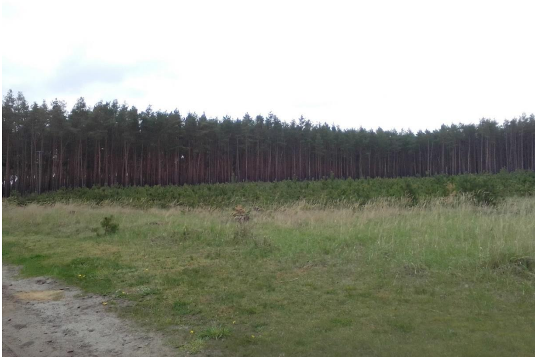
Bild 7: Nordöstlich an das Plangebiet angrenzende Kiefernauflorung