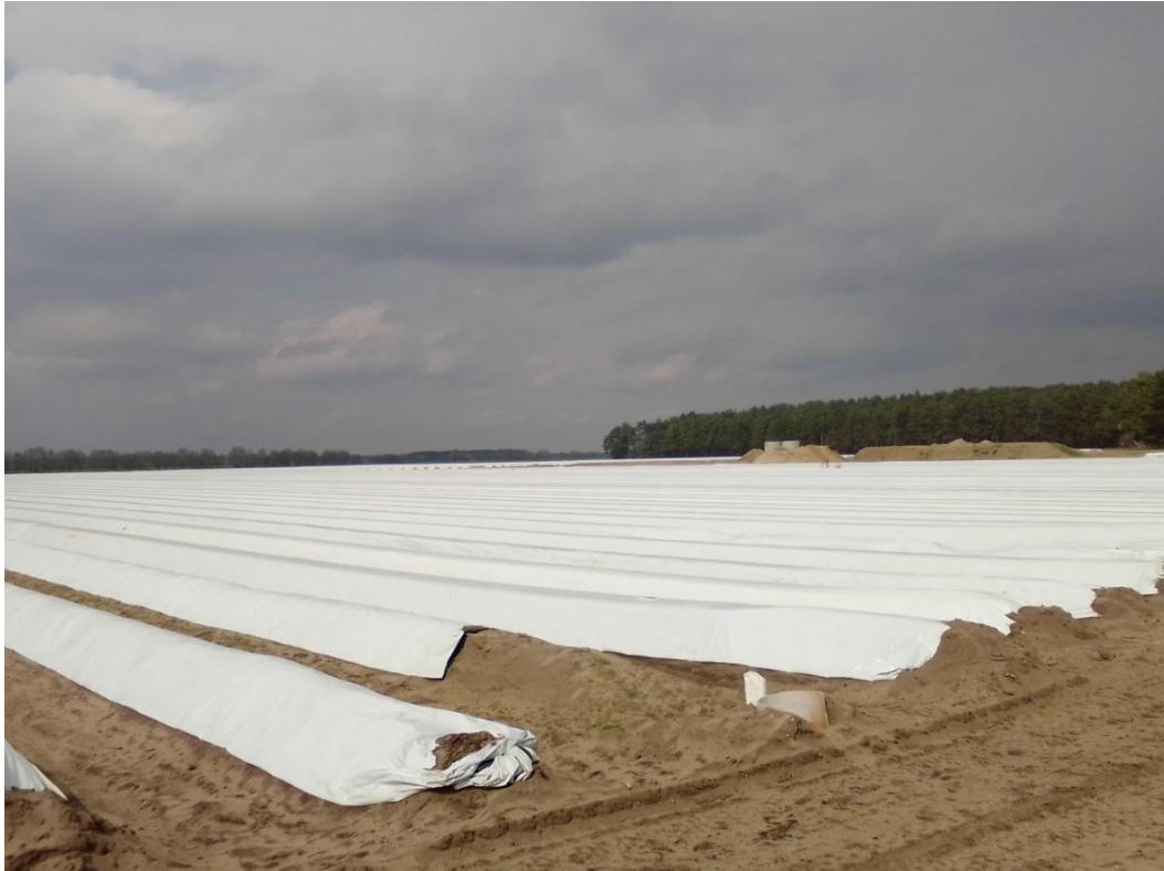
Bild 12: Blick nach Norden auf Spargelflächen im Nordteil des Plangebiets