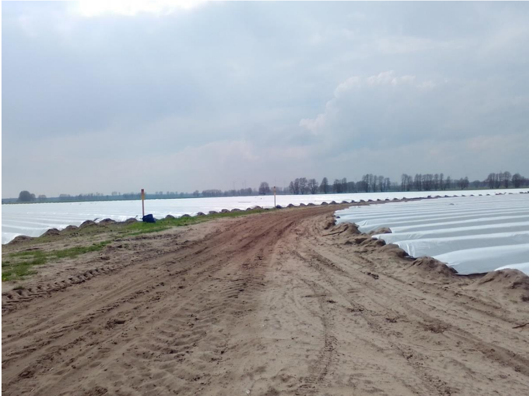
Bild 11: Blick nach Westen auf Spargelflächen im Westteil des Plangebiets